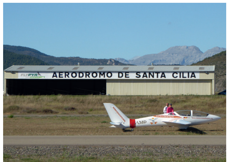
Ein großer Hangar für Segel- und Motorflugzeuge