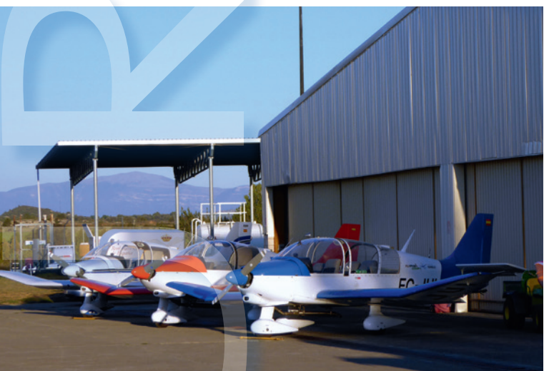
Die Schleppflugzeuge: 3 Robin DR400/180

Ich kann einen Besuch dieses wunderschönen Ortes nur empfehlen. Ein tolles Ambiente, zu dem Piloten aus fast allen europäischen Ländern beitragen, hervorragende Übernachtungsmöglichkeiten, von komfortablen und preiswerten Einzelzimmern im Dorf, über einen bequemen Campingplatz mit Bungalows als beste Lösung für Familien bis hin zu einem breit gefächerten Hotelangebot in Jaca oder sogar der Möglichkeit, Wohnwagen auf dem Flugplatz-Gelände selbst zu parken. Auf dem Flugplatz gibt es außerdem eine gemütliche Kneipe mit Restaurant und Swimmingpool und selbstverständlich sollen die Hilfsbereitschaft und Freundlichkeit der Angestellten nicht unerwähnt bleiben. Es ist sich ohne jeden Zweifel um eine ausgezeichnete Alternative für alle, die gerne im Gebirge fliegen. Also, warum eigentlich nicht? ♦